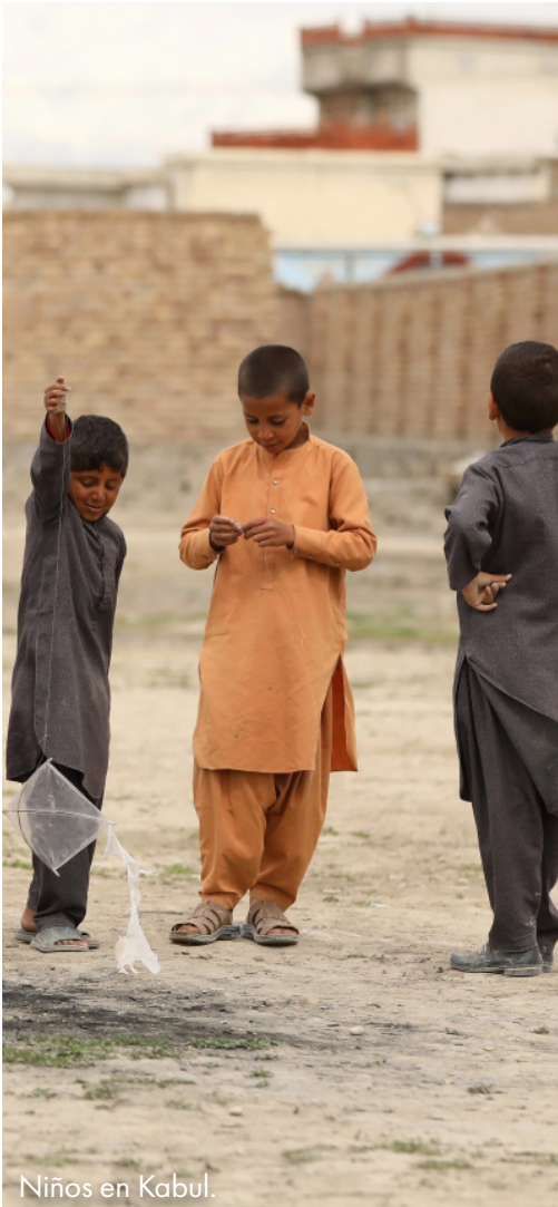
Niños en Kabul.

También puedes contribuir con tu donativo a fortalecer a la iglesia afgana.