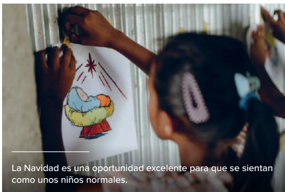
La Navidad es una oportunidad excelente para que se sientan como unos niños normales.

ponemos vestidos nuevos, cortamos una tarta y la comemos juntos».