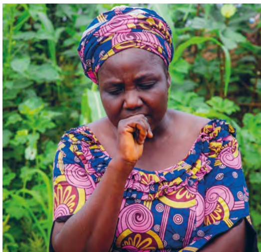
Charity se quedó traumatizada por el ataque; sus hijos estuvieron desaparecidos durante dos semanas.

Corrieron juntos, en dirección a las montañas. Hubo pánico y confusión. Dos de los hijos de Charity desaparecieron. Detrás de ellos, los extremistas continuaban matando cristianos e incendiando casas.